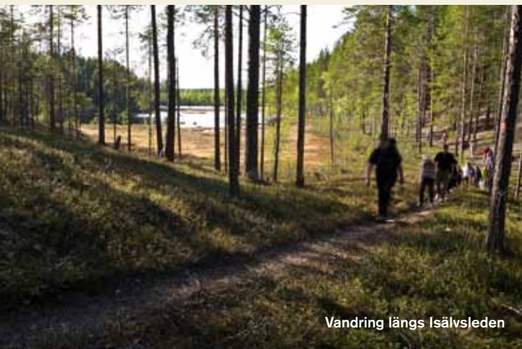
Vandring längs Isälvsleden

I Västerbotten nära Vindelälven vid Åmsele, ligger Ekopark Skatan. Här i "tallens och åsvandrarrens ekopark" vandrar man längs vackra lavbeklädda tallhedar på mäktiga åsformationer som bildades för mer än 8 000 år sedan, då inlandsisen började smälta. Genom denna, inte minst geologiskt intressanta ekopark, slingrar sig den populära vandringsleden – Isälvsleden. Njut av en promenad längs leden och upplev de gamla brandpräglade tallnatskogarna, där det områdesvis finns gott om död ved, som gör att just Skatan hyser ett flertal hotade vedinsekter. Se kungsörnen sväva över landskapet, fyll din korg med solmogna lingon, eller ta ett svalkande dopp i Skatans glittrande sjöar.