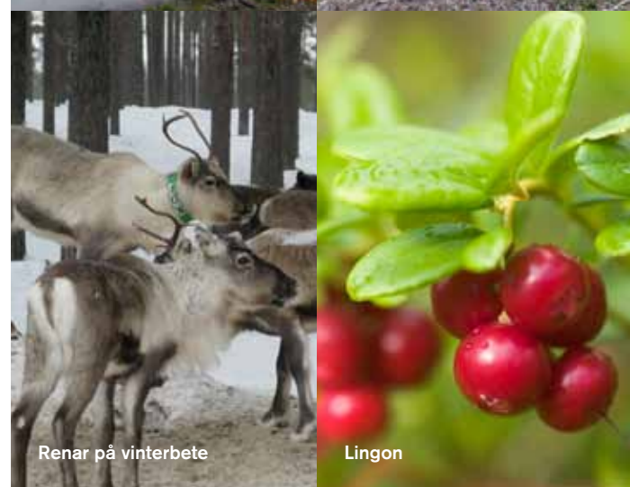
Renar på vinterbete