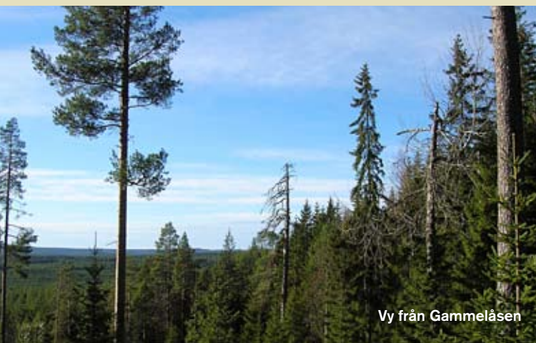
Vy från Gammelåsen

Människor har präglat Ovansjöns skogar under lång tid och här finns spår av både järnbruk, fäboddrift och gammal folktro.