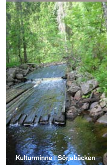
Kulturminne i Sörjabäcken