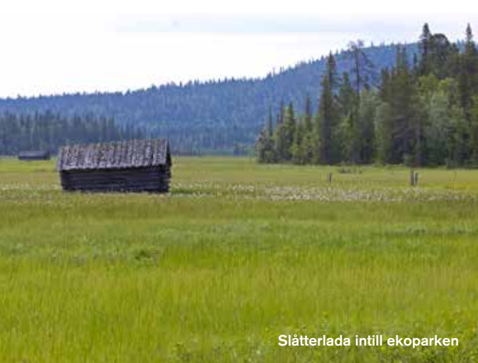
Slätterlador intill ekoparken

5 Vid Latnivaara finns gammal granskog som närmare bergstoppen övergår i fjällbjörkskog. Skogen är i hög grad orörd och här finns många naturvärdesträd, död ved och rikligt med skyddsvärda arter.