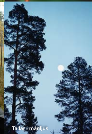
Tallar i månljus