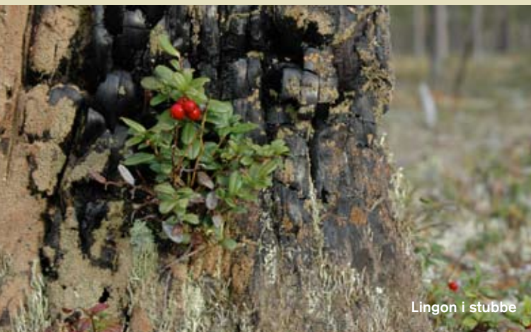
Lingon i stubbe

För att bevara och utveckla natur- och kulturvärdena i Vuollerims skogar har Sveaskog valt att göra området till ekopark.