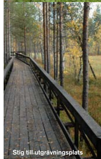
Stig till utgrävningsplats