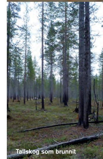
Tallskog som brunnit