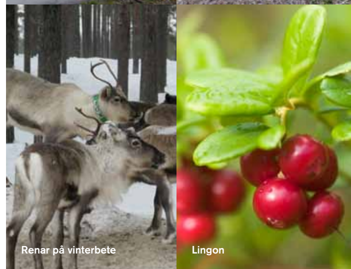
Renar på vinterbete