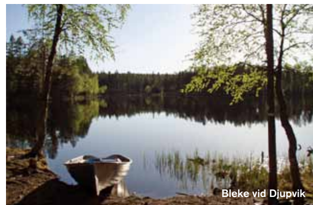
Bleke vid Djupvik

Att kalla Ekopark Skatan för "tallens och åsvandrarrens ekopark" är inte konstigt, då cirka 75 % utgörs av glesa parkliknande tallhedar. Tallskogarna växer på ett torrt sandrikt isälvsedimentunderlag, rikligt täckt av lavar och lingonris. På dessa torra marker tar sig bränder fort och var förr vanliga, vilket märken i form av brandljud på tallstammarna vittnar om. I ekoparken finns tallar av alla de slag, unga såväl som gamla tallar med grovbarkiga stammar, knotiga grenar och platta trädkronor. Dessa är viktiga boträd för rovfåglar, som kungsörnen, som häckar i Skatans skogar.