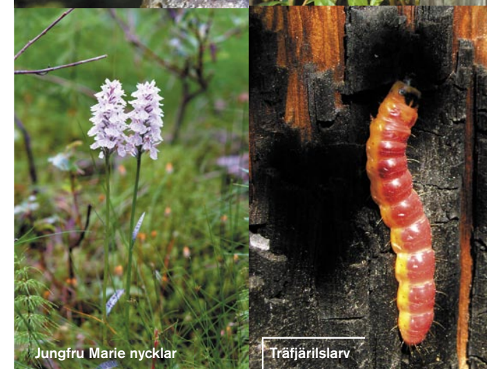
Jungfru Marie nycklar