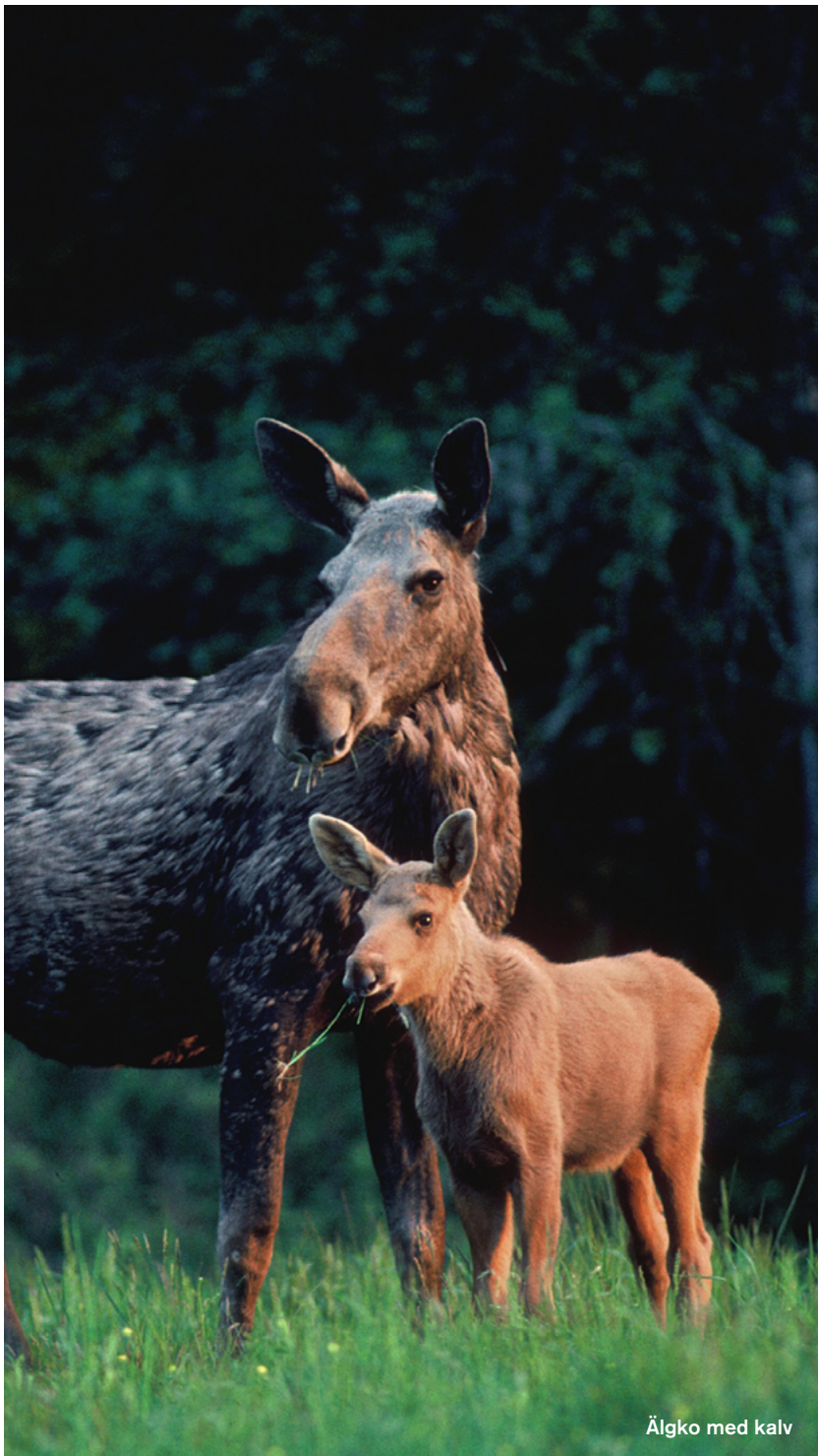
Älgo med kalv