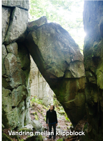
Vandring mellan klippblock