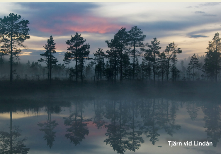
Tjärn vid Lindån