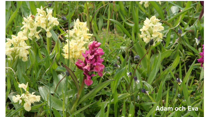
Adam och Eva

Öland kallas ibland för orkidéernas landskap. Den kalkrika marken gör att 28 av Sveriges 44 orkidéarter växer på Öland, många även i Böda. I kalkkärren och kalkfuktängarna står bland annat kärrknipprot, flugblomster, johannesnycklar och ängsnycklar. En karaktärsart för de kalkhaltiga ängstallskogarna är vit skogslilja, en bländande vit orkidé som inte finns lika rikligt någon annanstans i Sverige.