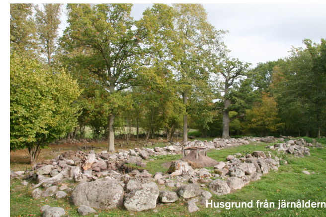
Husgrund från järnåldern