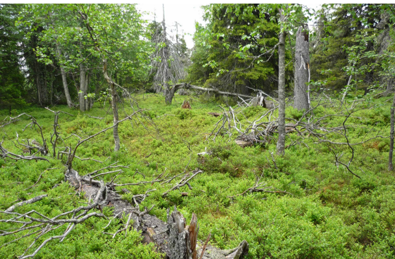
Höjdlägesskog (1834200: 7430370)

Mätt och belåten efter fikapausen, kan du fortsätta din vandring längs stigen vidare över berget Rautiorovas ena topp. Först kommer du in i ett område med mycket asp (1834020:7430800). Alla dessa aspar är förmodligen syskon och genetiskt lika. Aspen förökar sig nämligen genom rotskott och bildar därför ofta små syskonklumpar. Högre upp på berget är skogen formad av hårt väder. I