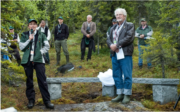
Ekoparksbänken (1833958: 7430859)

över den högsta kustlinjen. Under den senaste istiden fanns här troligen en stor sjö av smältvatten, som fortfarande var omgiven av osmält inlandsis. Vågorna i sjön, samt det strömmande smältvattnet från isen, spolade bort sand och grus från bergsslutningarna och lämnade kvar kala berg-hällar och stora stenblock. Dessa blankspolade klipphöllar, kan även ses på Taka-Aapua och andra berg i närområdet. På de magra klipphöllarna växer det tall. Här har tallen klarat sig, eftersom granen inte kan konkurrera ut den på dessa magra marker. Du kan också se brända tallhögstubbar, vilket visar att det brunnit i just detta område. Från stenbänken, som är ett minne från invigningen och symboliserar vila, omtanke och varaktighet, har du en fin utsikt norrut över skog och myr. Ta fram kikaren. Då kan du se det gamla brandbevakningstornet på Taka Aapua.