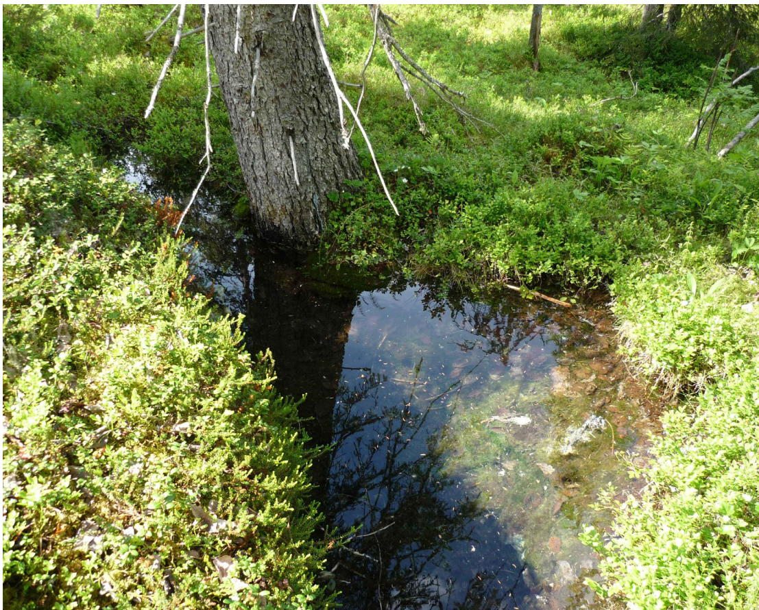
Kalkkälla (1833858: 7430842)

När du väl kommit fram till stenbänken, så kan du se att den är placerad på ett område med berghällar trots att vi är högt