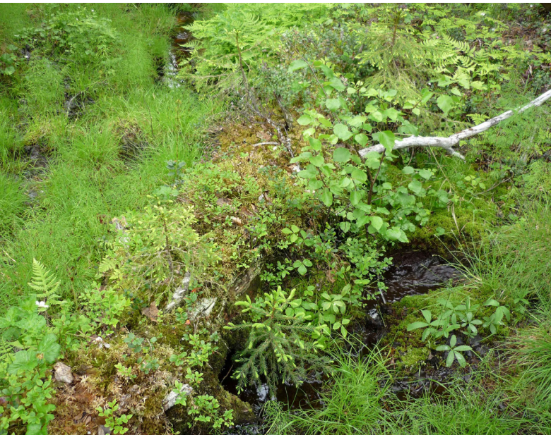
Levande död ved

Nu har du kommit fram till nästa vägval (1833742:7430277). Rakt fram fortsätter stigen mot ekoparksbänken och till vänster tar den spångade stigen dig först över ett sumpigt område, innan den till slut leder fram till bilvägen och trevägskorsningen. Om du nöjer dig med det du redan sett av ekoparken, ska du ta den spångade stigen åt vänster. Längs den stigen, över det sumpiga området, hittar man de äldsta granarna som är betydligt äldre än de granar du finner längs naturstigens andra delar. När du vandrat genom sumpskogen och når vägen, tar du vänster igen och promenerar tills du når bilen.